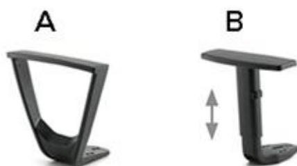
Braccioli già montati / Pre-assembled arms