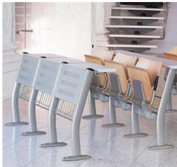
banco con piano ribaltabile