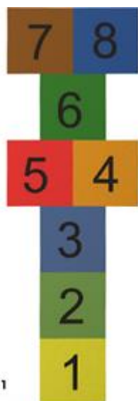
GIOCO CAMPANA 1