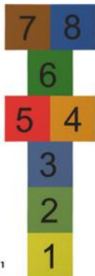
GIOCO CAMPANA 1