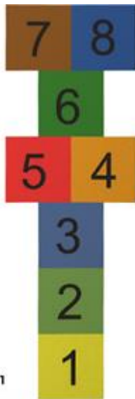
GIOCO CAMPANA 1