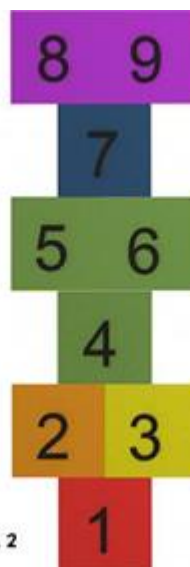
GIOCO CAMPANA 2