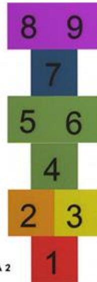
GIOCO CAMPANA 2