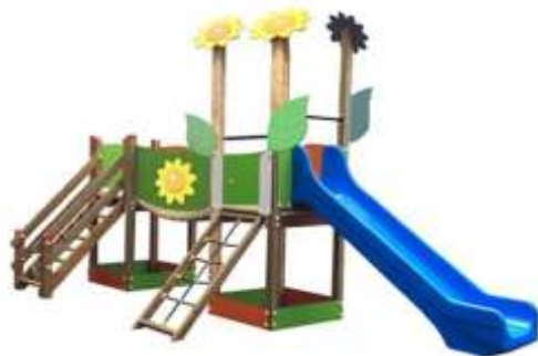
PE02131 € 1.990,00