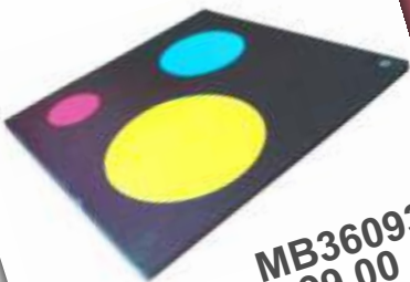
MB36093 € 99,00