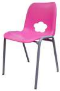
SE3105X € 12,90