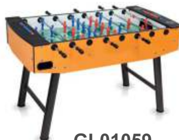
GL01059 € 399,00