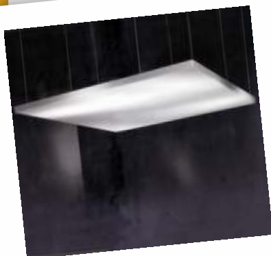
PANNELLO INSONORIZZANTE SOSPESO DIM: 120X120 CM