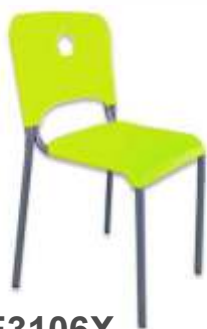
SE3106X € 16,50