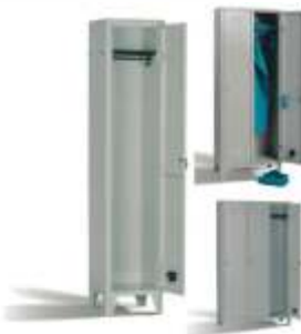
SP21001 € 65,00