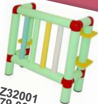
SZ32001 € 79,00 AL MQ