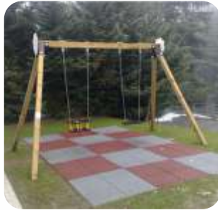
PE0211X € 390,00