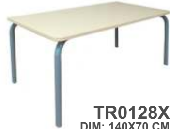
TR0128X DIM: 140X70 CM € 89,00