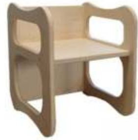
SE0107X € 28,90