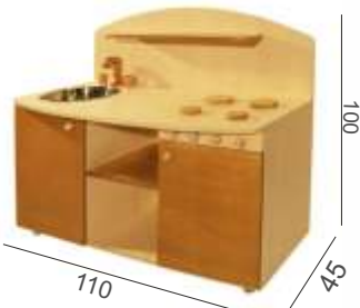
GL01060 € 175,00