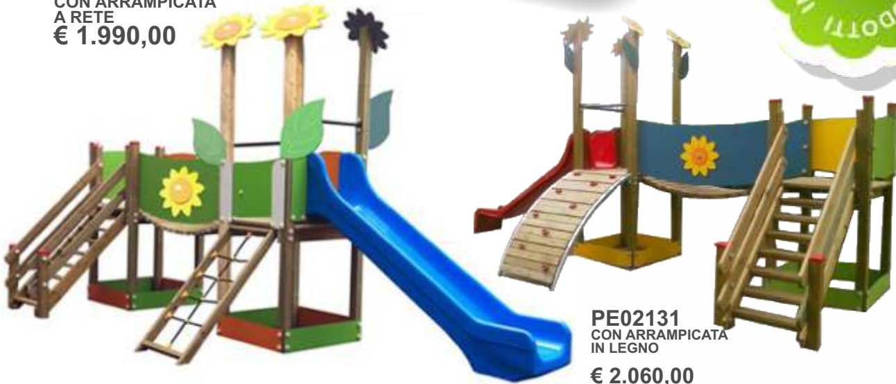
PE02131 CON ARRAMPICATA IN LEGNO € 2.060,00