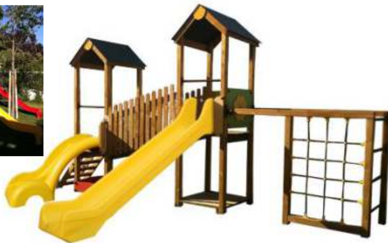
PE02154 € 3.250,00

* Tutti i prezzi sono da considerarsi esclusi di IVA 21%, franco fabbrica