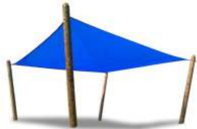
PE02118 € 490,00