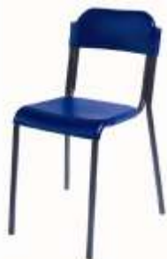
SE31001 € 14,90