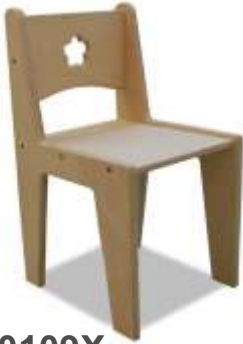
SE0109X € 34,90