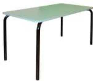
TR0128X DIM: 140X70 CM € 89,00