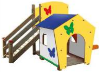
PE02121 € 1.450,00