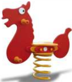
PE01019 € 285,00