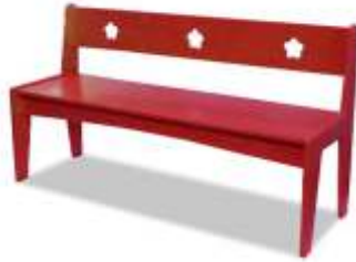
PA0106X € 65,00