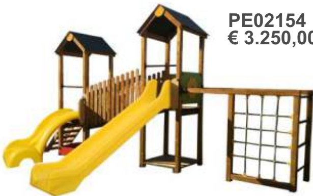
PE02154 € 3.250,00