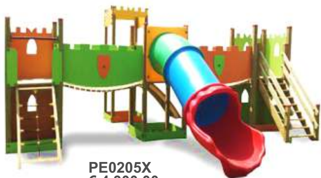
PE0205X € 4.300,00