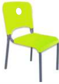
SE3106X € 16,50