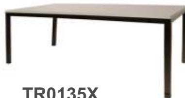
TR0135X DIM: 156X78 CM € 78,00