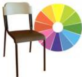
SE31003 € 16,50