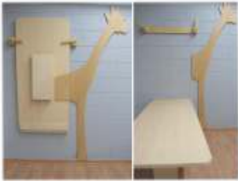
TR0104X € 129,00